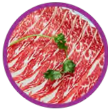
美國雪花肥牛 (小/大)