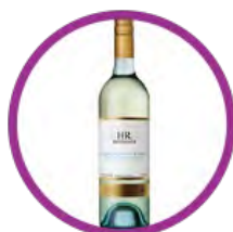
澳洲 Heritage Road 白蘇維翁白酒