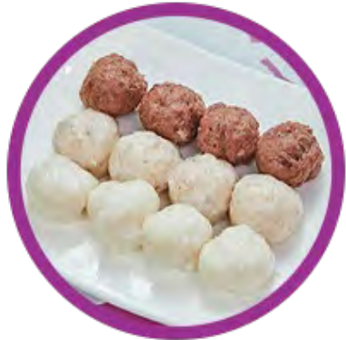
自選手打三併丸 (四款自選三款)