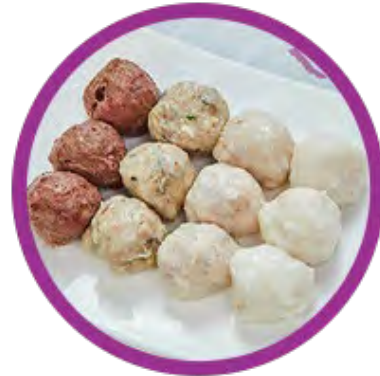
手打四寶丸 (墨魚, 鮮蝦, 鮫魚, 鮮牛)