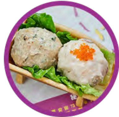
自選手打雙併滑 (四款任選兩款)