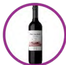
阿根廷 聖安納紅酒