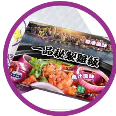
一品秘製雞飯 (不辣)

一品秘製雞飯盒，飯盒儲存方便， 可儲存於攝氏零至四度或急凍雪櫃內， 保存期可長達2個月， 以微波爐或熱水蒸翻熱即可食用。