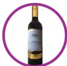
澳洲 Heritage Road 西拉紅酒