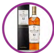
Macallan 12 年威士忌