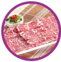
A 級安格斯肥牛 (小/大)