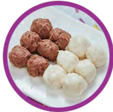
自選手打雙併丸 (四款自選兩款)