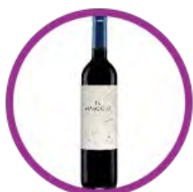
阿根廷 瑪斯各紅酒