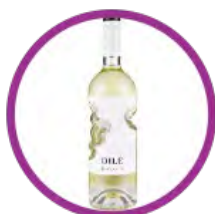
意大利 DILE 白酒