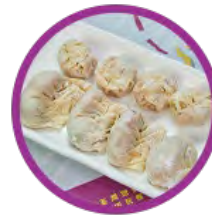
自選雙併餃 (四款任選兩款)