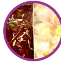
自選鴛鴦鍋 (六款自選兩款)